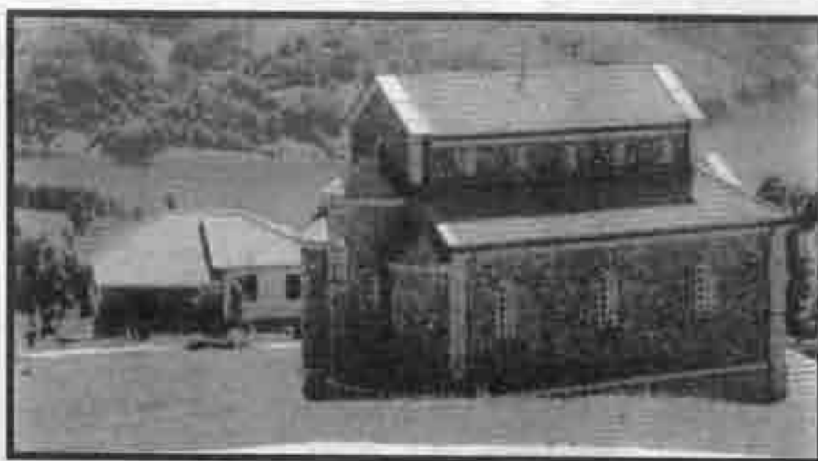
Нови манастир Рујно са конаком

Новоподигнути манастир Рујно, посвећен св. Георгију, завршен