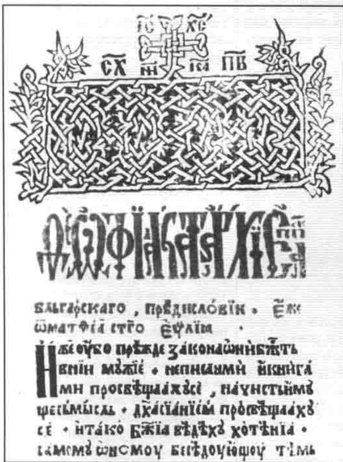
Трећа страница Рујанског чејворејеванђеља

Претпоставља се да је манастир Рујно опустео око 1567. године. Срушен је у другој половини 16. века. Од њега није остао ни камен на камену, али преживело је Рујанско чејворејеванђеље и у њему записани подаци. Као далеки ехо у селу Врутцима настала је и казивана бледа легенда о закопаном манастирском благу и плавичастом пламену који гори на манастиришту. Према легенди требало је доћи на то место пре зоре и посути га пепелом. Изјутра би се на пепелу указале стопе овце, говечета или неког другог брава. Ту животињу је требало заклати па онда почети откопавати закопано злато. Ако би се у пепелу пока-